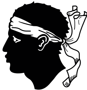
De Corsicaanse Vlag

Songfestivalwinnaar: "Every way that I can van Sertab Erener was in 2003 de winnaar uit Turkije. Ik heb voor dit jaar groot vertrouwen in de Toppers!"