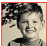
Jan Marijnissen (1952)