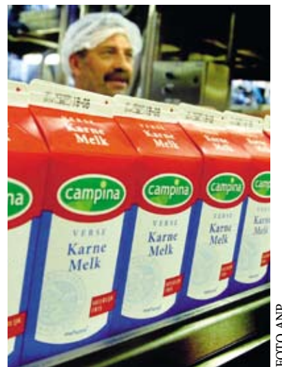
Renske Leijten kan niet zonder karnen

Geschiedenis hoofdstuk: "De Vlaamse taalstrijd. De Vlamingen ontworstelden zich via culturele en politieke weg aan het Franse (Waalse) juk. Een beweging van vele gezindten politieke stromingen, met ook zwarte bladzijdes als de collaboratie met de nazi's." Nationale drank: "Nederlandse karnemelk. Daar waar iedereen een drop, stroopwafels en pinda-kaas mist in het buitenland, kan ik