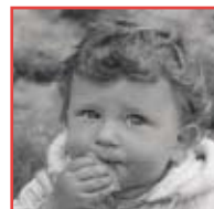
Emile Roemer (1962)