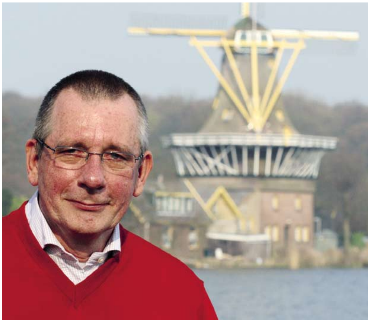
FOTOGRAFIE: ALEX WOLF