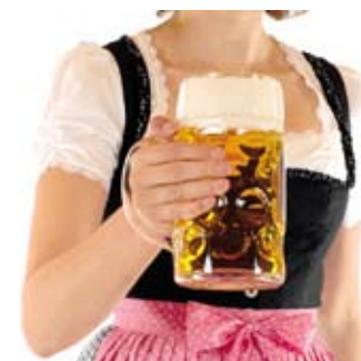
Lijfdrank voor op de stamtsich

Nobelprijswinnaar: “Doris Lessing met haar stevige boeken en kijk op het kolonialisme.”