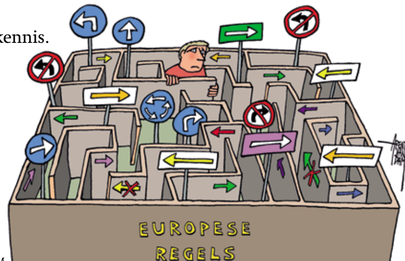
ILLUSTRATIE: AREND VAN DAM