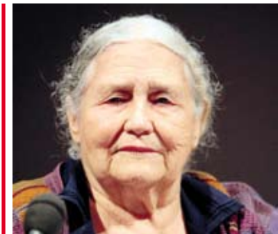
Nobelprijswinnares Doris Lessing