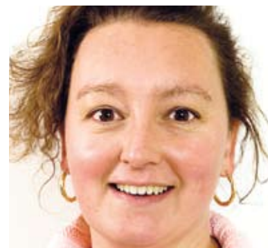
2. Kartika Liotard (1971), Europarlementariër "We mogen niet toestaan dat geheime adviseurs en anonieme lobbyisten het in Europa voor het zeggen hebben."