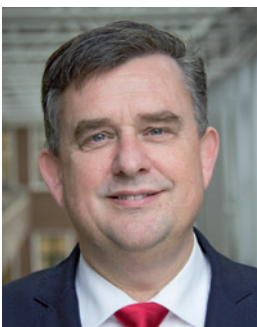
Emile Roemer Voorzitter SP-Tweede Kamer