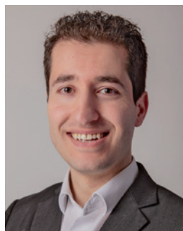
Farshad Bashir SP-Tweede Kamerlid