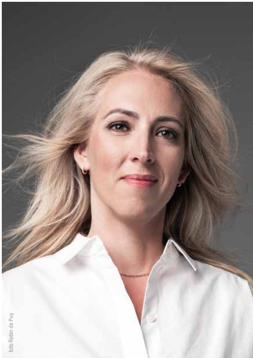
1. Lilian Marijnissen (1985, Oss) Lijsttrekker en huidig fractievoorzitter SP Tweede Kamerfractie