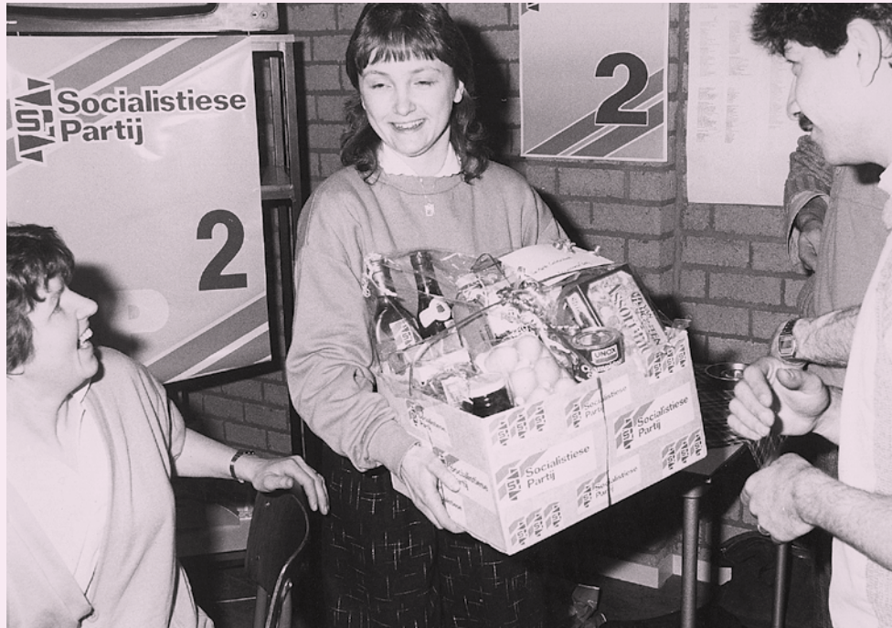
In 1982 voerde de SP in Oss campagne tegen de economische crisis, zoals te zien is op deze afbeelding van een levensmiddelenmand.

Een stad waar de SP in 1982 doorbrak, was Leiden. Vooral de huur- en buurtacties die gezamenlijk met huurders en bewoners werden gevoerd, maakten een verschil. Met 125 leden en sympathisanten die eerder hadden deelgenomen aan de acties, werd een krachtige organisatie van SP'ers opgebouwd, die overal in de stad te vinden waren en meer dan honderdduizend folders verspreidden. De SP sprong in een gat dat de PvdA had laten vallen, door samen met de VVD de stad te besturen en op veel terreinen te bezuinigen. De partij boekte vooral winst in volksbuurten in het noorden van Leiden, waar de PvdA aanzienlijke verliezen had geleden.