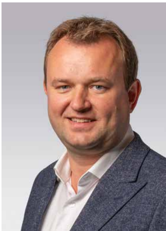
3. Bart van Kent (1983, Den Haag) SP-Kamerlid, woordvoerder Sociale Zaken en pensioenen