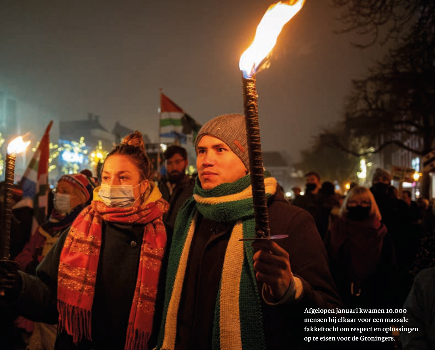
Afgelopen januari kwamen 10.000 mensen bij elkaar voor een massale fakkeltocht om respect en oplossingen op te eisen voor de Groningers.

congress hearings. Daar heb je hele opgepompte betogen, da's een beetje zoals interrupties hier. Het gaat bijna meer om de vraag die je stelt dan om het antwoord wat er komt. En dat is dit expliciet niet. De verhoren zijn voor ons om informatie te halen en ook voor mensen om verantwoording af te leggen. Maar wij trekken onze conclusies en die delen we in dat rapport. Ik zit daar namens de Tweede Kamer. Natuurlijk, ik ben altijd SP'er, dat kan je niet uitzetten. Maar in principe is het een opdracht namens de Kamer.'