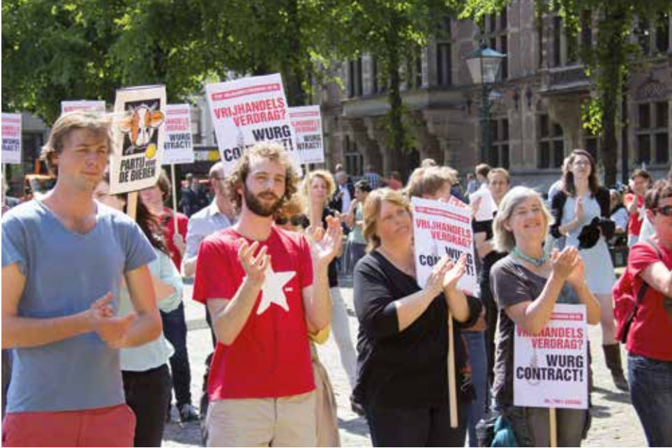
Demonstratie in mei 2014 tegen het vrijhandelsverdrag tussen de EU en de VS, TTIP.

aangespannen omdat de vrijhandelsverdragen voorzien in geschillenbeslechting tussen investeerders en staten, het zogeheten Investor State Dispute Settlement (ISDS) . Als het TTIP-verdrag doorgaat, moeten onze wetgevers dus eerst in overleg met het Amerikaanse bedrijfsleven om te horen of we ze niet te veel hinderen bij het maken van zoveel mogelijk winst. Dat is de wereld op zijn kop, dan heeft het neoliberalisme definitief gewonnen. Alles voor de winst, en de winst vóór alles.