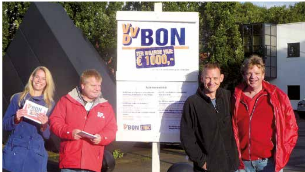
De VVD-bon-actie is bedacht tijdens een van de opdrachten van de Zomeruniversiteit 2013.

‘Sinds eind jaren tachtig zijn de bakens veranderd. Het idee leefde toen dat het Westen de Koude Oorlog had gewonnen. Het vrijemarktdenken werd dominant, waardoor het vrijhandelsverkeer een enorme boost kreeg. Landen werden gedwongen zich open te stellen als afzetgebieden. Door de vrijhandelssfeer kwamen de arbeidsrechten onder druk te staan. De arbeidsmarkt werd geflexibiliseerd, lonen gingen omlaag en – voor zover aanwezig – werd het ontslagrecht versoepeld. En ten behoeve van de concurrentiepositie wordt ons sociale zekerheidsstelsel langzamerhand om zeep geholpen. Voor ons als socialisten is het zaak om op deze processen vanuit onze ideologie fundamentele kritiek te leveren. Deze