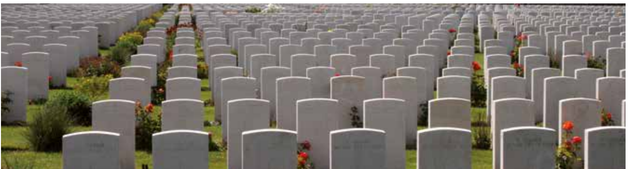
Britse militaire begraafplaats met gesneuvelden uit de Eerste Wereldoorlog in Passendale.

Toen de oorlog vier jaar later over was, was het ook over met de keizerrijken van Duitsland, Oostenrijk, Rusland – en Turkije, dat partij voor de Duitsers gekozen had en daaraan bezweek. De Russische tsaar werd afgezet en vermoord en zijn keizerrijk opgevolgd door de communistische Sovjet-Unie. De Duitse keizer vluchtte tegen het einde van de oorlog naar het neutraal gebleven Nederland, tekende daar zijn officiële troonsafstand en woonde tot zijn dood in Doorn – Nederland wees een verzoek tot uitlevering wegens oorlogsmisdaden af en gaf de gewezen keizer politiek asiel. Oostenrijk en Turkije werden republieken. De landkaarten van Europa werden opnieuw getekend, met een veel kleiner Duitsland, Oostenrijk, Rusland en Turkije en tal van nieuwe staten, zoals Polen, Tsjecho-Slowakije, Hongarije, Joegoslavië, Albanië, Finland, Estland, Letland en Litouwen. Vele daarvan werden lid van de nieuwe Volkenbond, die ervoor zou moeten zorgen dat er geen oorlogen meer zouden kunnen uitbreken. Maar die mooie gedachte botste op snel groeiend agressief nationalisme. Vanaf 1933 heerste in Duitsland het nationaalsocialisme van Adolf Hitler en was de Tweede Wereldoorlog in de maak.