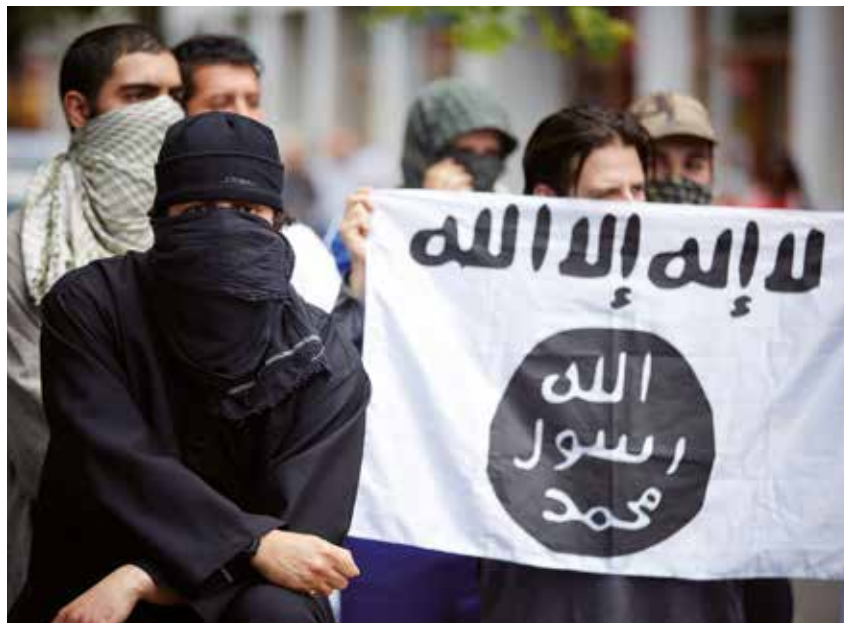
Radicaal islamitische jongeren betuigen steun aan ISIS tijdens een demonstratie in Den Haag op 24 juli.

Ook vallen in dit boek harde woorden over de slechte omgang met het milieu. 'De fossiele brandstoffen industrie, vernietigt ondertussen meedogenloos het ecosysteem voor de winst.' Hoe dat in olierijke moslimlanden gaat vertelt het boek niet. Wel dat de sharia economische stabiliteit brengt, evenals bescherming van privacy – zelfs vrijheid van godsdienst. En dat het rechten zal geven aan vrouwen (die eindelijk 'in harmonie' kunnen leven met hun man) en dieren (een vrouw komt in de hel als ze haar kat niet voldoende te eten geeft).