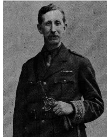
De Engelse officier Mark Sykes en zijn Franse collega Georges Picot, die in 1916 de basis legden voor de kaart van het Midden-Oosten.

roep van de politieke islam als antwoord op het mislukte nationalistisch project van de Arabische wereld. Geen enkele Arabische staat kon zich bevrijden van het westers kolonialisme. Ook de vestiging van de staat Israël werd als een westers koloniaal project gezien. De pogingen van Arabische pan-nationalisten als Nasser (Egypte), Assad (Syrië) en Hoessein (Irak) in de periode 1950 – 1990 liepen op niets uit. De Amerikaanse invasie in Irak in 1991 en zeker die in 2003 heeft het nationalistische Arabisch idee definitief vernietigd. De westerse samenwerking met autoritaire staten heeft er al die jaren niet onder geleden. Ten einde de invloed van Irans revolutie in te dammen richtten de Amerikanen (in 1983) het Centraal Commando op, CENTCOM, vestigden ze militaire bases in Jordanië, Saoedi-Arabië en gingen ze op tal van manieren nauwe politiek militaire samenwerking aan met Arabische dictaturen. 4 De Amerikaan-