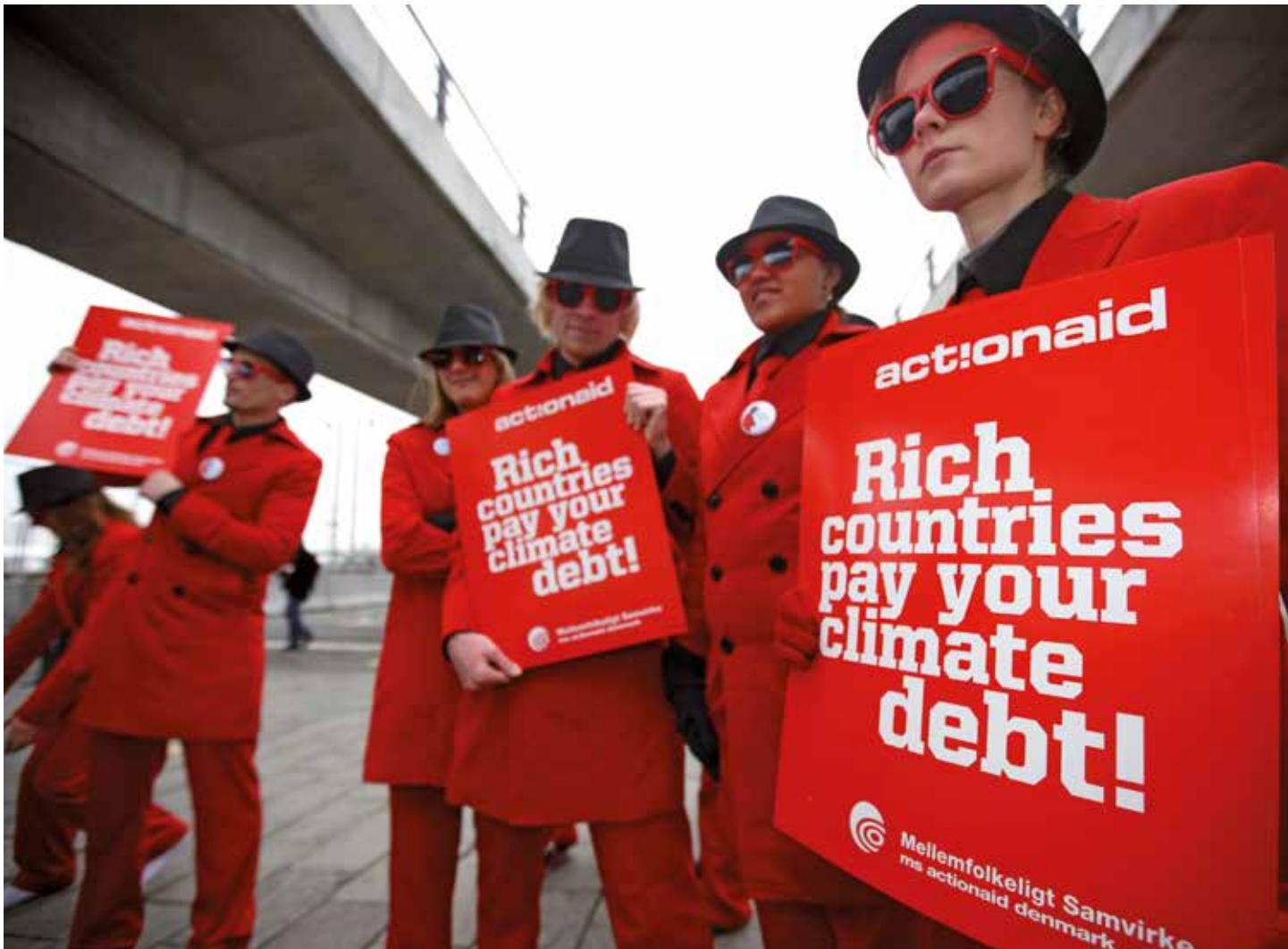
9 december 2009. Milieuactivisten roepen bij een demonstratie tijdens de klimaatop in Kopenhagen de rijke landen op om de uitstoot van broeikasgassen te verminderen en de schade te vergoeden die ze het milieu hebben toegebracht.