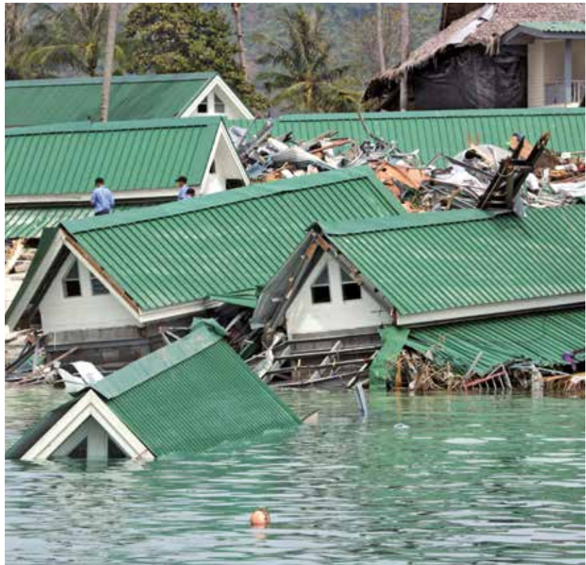
Bram Büscher: 'De mensen die het minst hebben bijgedragen aan klimaatverandering en er het minst weerstand tegen kunnen bieden, worden het zwaarst getroffen.'

'Vanwege twee redenen. Ten eerste omdat de materiële veranderingen die milieuwetenschappers waarnemen,