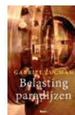
Gabriel Zucman Belastingparadijzen Uitgeverij Boom

Zucman heeft al met al een vlot leesbaar en informatief boek geschreven. De oplossingen die hij aandraagt om belastingparadijzen aan te pakken zijn juist, maar het is de vraag of ze (binnen afzienbare tijd) gerealiseerd kunnen worden. De invloed die het grootkapitaal op de politiek uitoefent is immers zeer groot. Helaas noemt hij Nederland, dat toch ook vaak als belastingparadijs bestempeld wordt, niet in zijn boek. In een interview met de Volkskrant zei hij dat je Nederland voor wat betreft het beheeren van privévermogens niet kunt vergelijken met belastingparadijzen als Zwitserland. Zucman erkent wel dat Nederland een belangrijke rol vervult in internationale belastingconstructies van multinationals, waardoor bedrijven als Google extreem weinig belasting betalen.