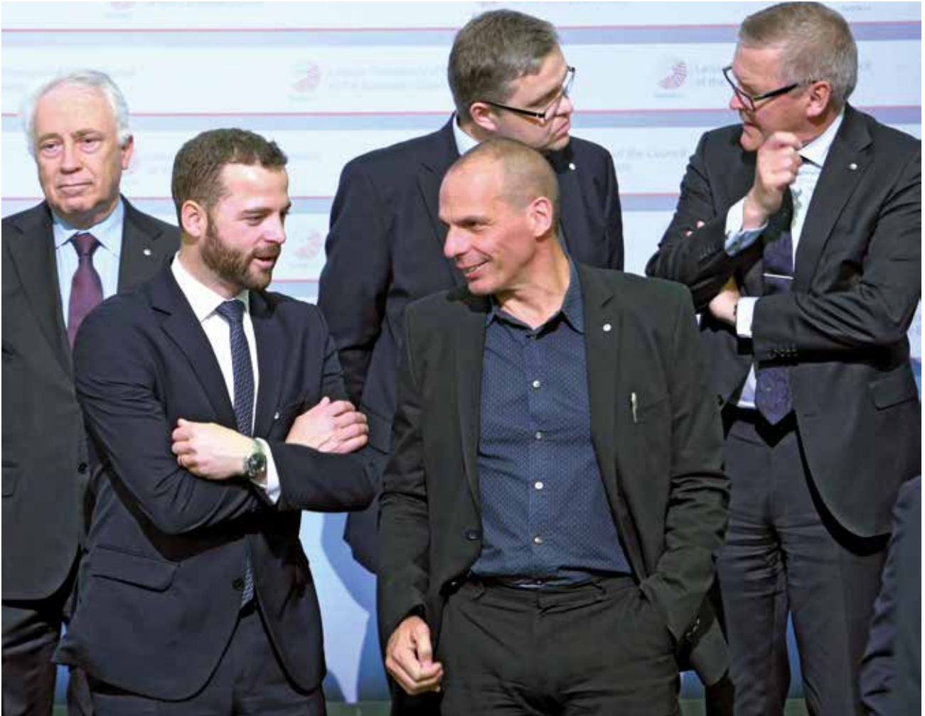
De Griekse minister van Financiën Varoufakis te midden van zijn ambtgenoten uit de eurozone tijdens onderhandelingen in Riga op 24 april.

nente rol toebedeeld hebben gekregen – als een succes. Ten tweede laat de krant onvermeld van wie de ‘aanvallen’ kwamen, namelijk onder andere van de media.