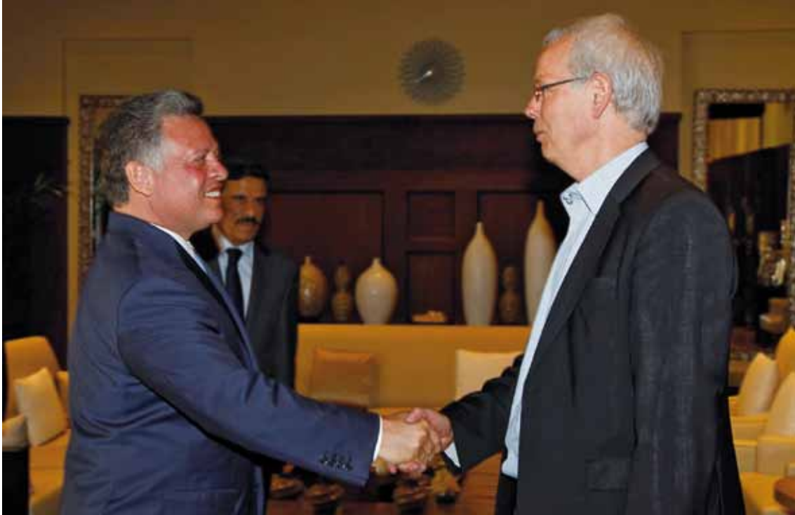
Tiny Kox schudt de Jordaanse koning Abdullah II de hand.

overleven. Maar, de andere kant van de samenwerking is dat Europa de Palestijnen veel beter dan nu zal moeten helpen om de mensenrechten van de Palestijnse bevolking daadwerkelijk te beschermen. En dat kan niet anders dan door veel nadrukkelijker stelling te nemen tegen de illegale bezetting en illegale kolonisatie van Palestijns gebied door buurland Israël.