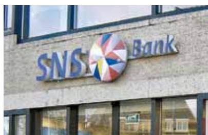
Drie van de vier Nederlandse grootbanken liggen al aan het staatsinfuus.

noch moraal tegen laten houden, zoals ook bleek bij het Libor-schandaal, waarbij onder andere de Rabobank rentes heeft gemanipuleerd.