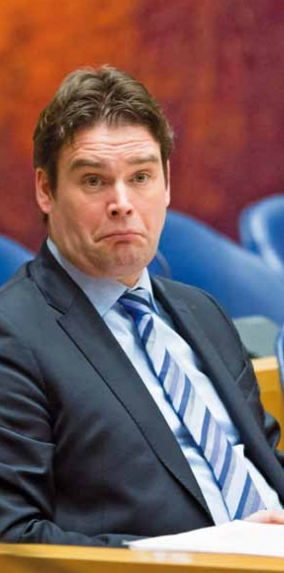
Staatssecretaris van Financiën Frans Weekers.

de uitvoering van het verdrag. Maar de werkelijkheid heeft zich anders ontwikkeld. Inmiddels zijn er zo'n 3000 IBO's, waarvan 190 tussen EU-landen. Speelt gebrek aan rechtstaat daar echt een rol?