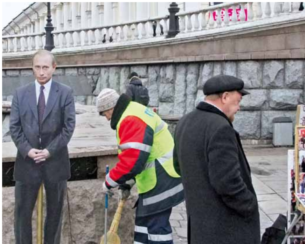
Kartonnen display van de alom aanwezige president Poetin.

om de kans op een dialoog tussen Rusland en Europa een nieuwe kans te geven.