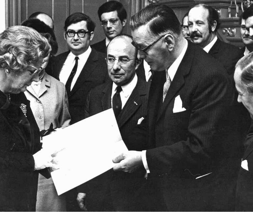
Den Haag, 1971. Koningin Juliana neemt het eindrapport van de staatscommissie inzake kieswet en grondwet in ontvangst, dat een belangrijke rol zou spelen bij de grondwetsherziening van 1983.

zou men in Nederland beter het opiumschiiven kunnen toestaan, dan de besmetting van de geestelijke gezondheid, welke thans door middel van de drukpers plaats vindt.' De overheid moest volgens Romme de mogelijkheid hebben om in te grijpen in het publieke debat.