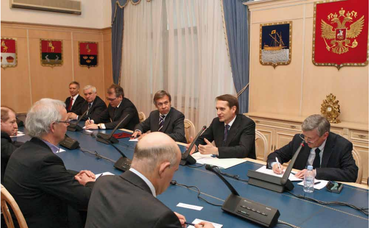
Tiny Kox in gesprek met Doemavoorzitter Sergey Naryshkin (aan het woord) en de Raad van Europa-delegatieleider Aleksey Pushkov (links van Naryshkin).

Tekst: Tiny Kox Foto's: Archief Tiny Kox