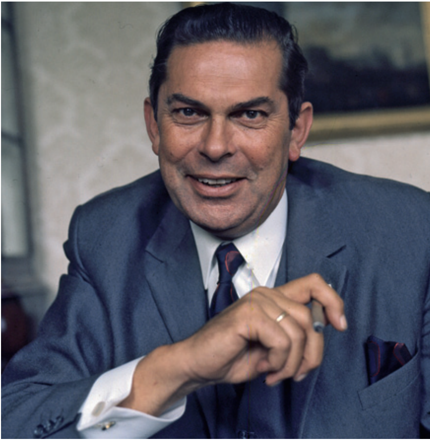
‘Open’ Barend Biesheuvel.

genheden. Je moet zo’n stuk aardig weten te brengen. Dat is het geheim, anders pikt de Kamer het niet en het publiek nog minder.’