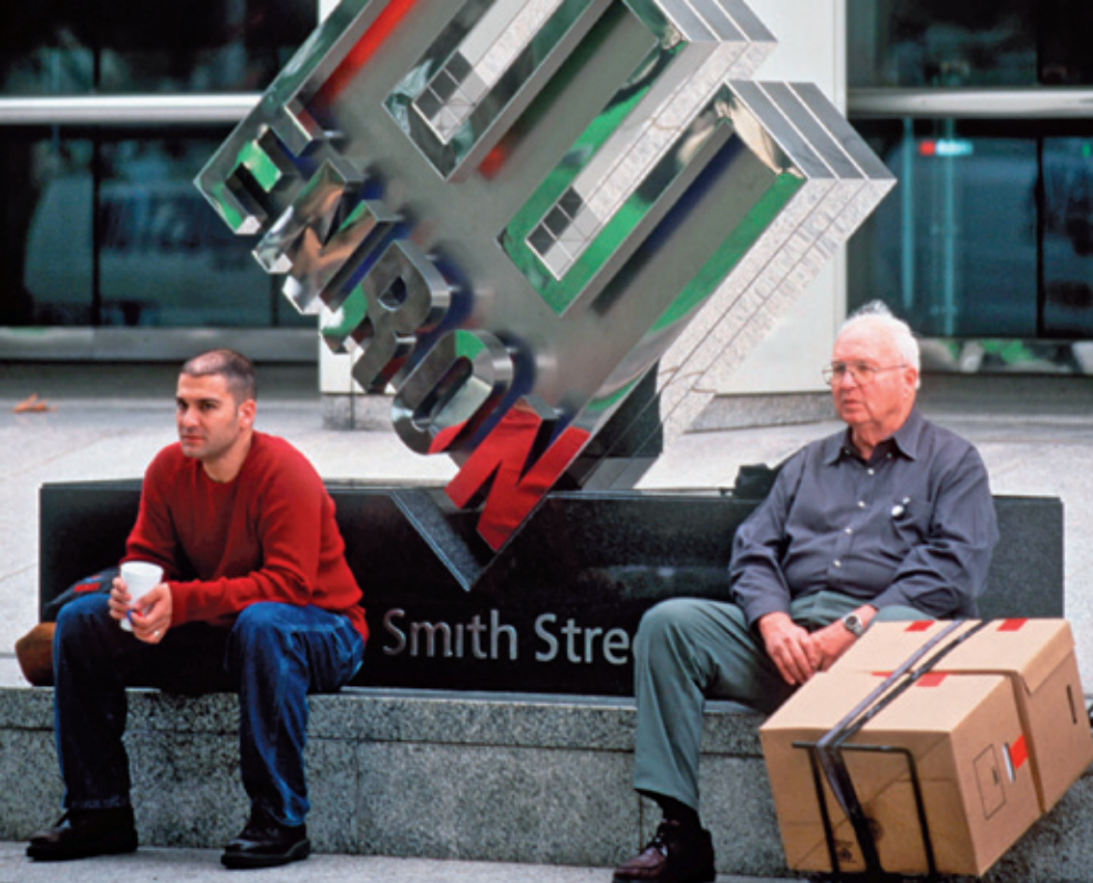
Medewerkers van Enron moeten hun spullen pakken omdat het bedrijf door mismanagement failliet is gegaan.

je hiermee bij je werkgever in de smaak valt. Daarmee ben je in een voortdurende strijd met anderen verwickeld om je baan te behouden; wat vanzelfsprekend gevolgen heeft voor je identiteit. Hierover gaat het boek van de Vlaamse klinisch psycholoog Paul Verhaeghe.