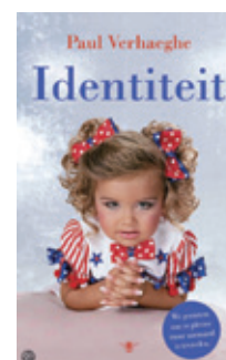
Paul Verhaeghe Identiteit Uitgeverij: De Bezige Bij (2012) 272 pagina's ISBN: 978 90 234 7303 9 prijs: € 19,90