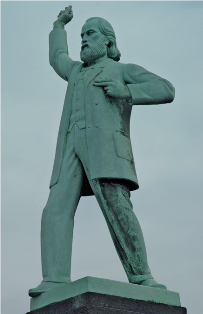
Het standbeeld van Ferdinand Domela Nieuwenhuis (1846-1919) in Amsterdam.