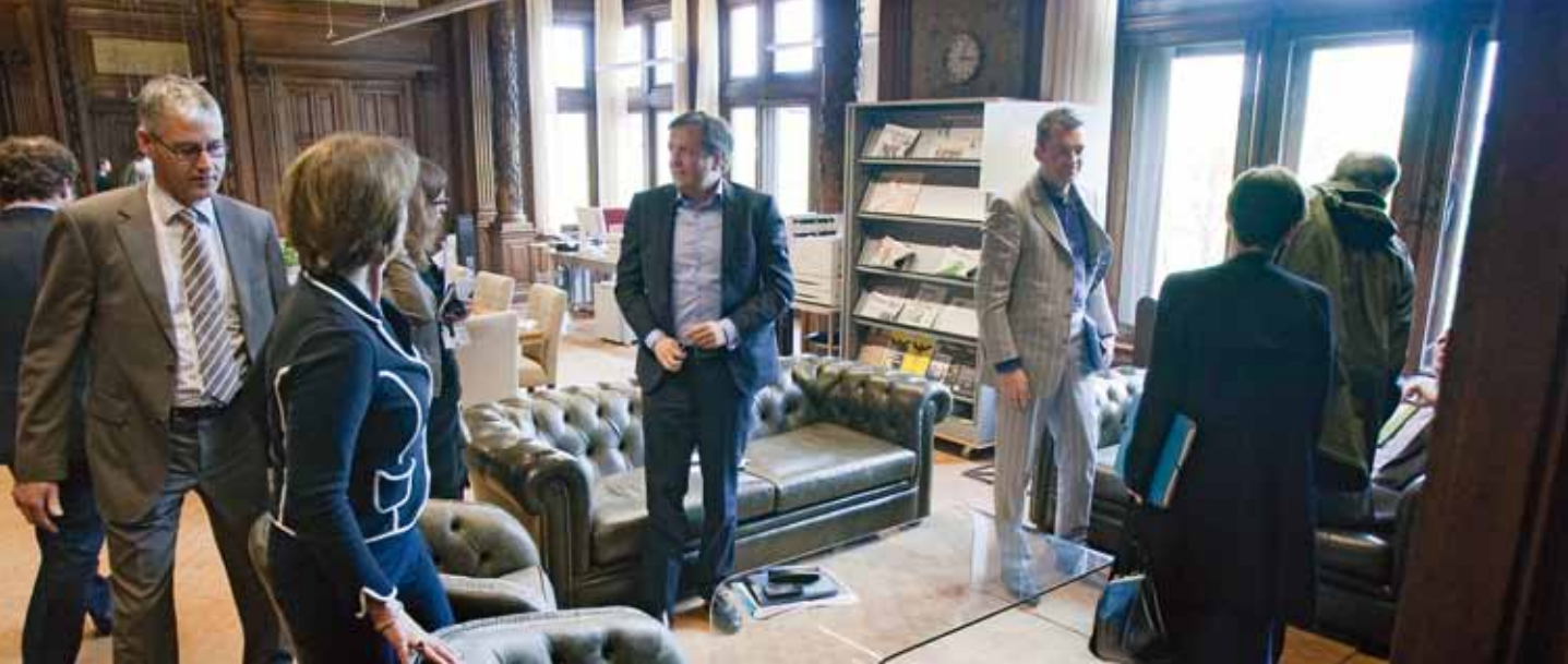
De vertegenwoordigers van de Kunduz-partijen komen bijeen om te onderhandelen.