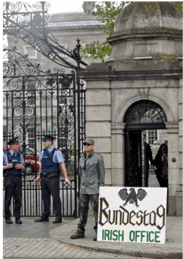
Demonstrant voor de ingang van het Ierse Parlement.

Eindigen we met een compliment voor de Ieren. Ondanks hun imago van stevige drinkers met een voorliefde voor volksmuziek, tatoeages en trainingsbroeken, ging het er opvallend beschaafd aan toe tijdens de ESM-campagne. Van de duizenden affiches met politieke boodschappen die er hingen in Dublin, was er niet een beklad of vernield. En bij het bezoek aan het parlement, het hart van de democratie, geen paspoortcontrole, geen scan, geen gedoe, maar een 'Welkom' en 'Komt u verder'. Ministers en ambtsdragers die zich ontspannen mengen onder het publiek. Kom daar maar eens om in andere Europese hoofdsteden, waar de politieke elite een blokje om loopt om de man of vrouw in de straat te ontlopen.