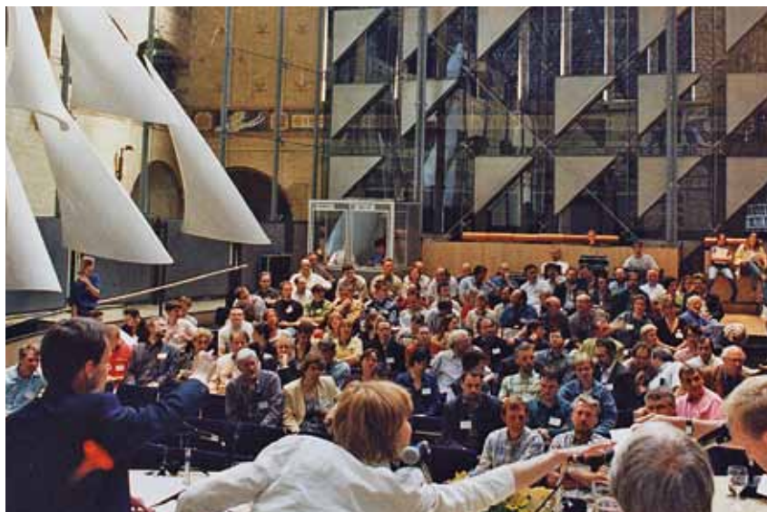
14 juni 1997 Alternatieve Eurotop in de Beurs van Berlage Amsterdam.