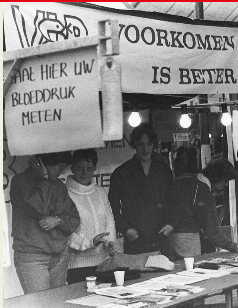
Je bloeddruk laten meten in Oss in 1975, een goede manier om leden te maken voor de Vereniging Voorkomen Is Beter.

Later kwamen nog medische centra in Nijmegen (1978) en in Zoetermeer (1981). In september 1975 startte ook Vereniging Voorkomen is Beter (VVIB), een massaorganisatie voor een betere zorg. Daarmee vroeg de SP al heel vroeg aandacht voor de sociaaleconomische gezondheidsverschillen en vooral voor de preventieve gezondheidszorg. Centraal actiepoint was een jaarlijkse gezondheidstest voor iedere Nederlander, om ziekten eerder op te sporen en erger te voorkomen. Leden gingen onder meer de deuren langs