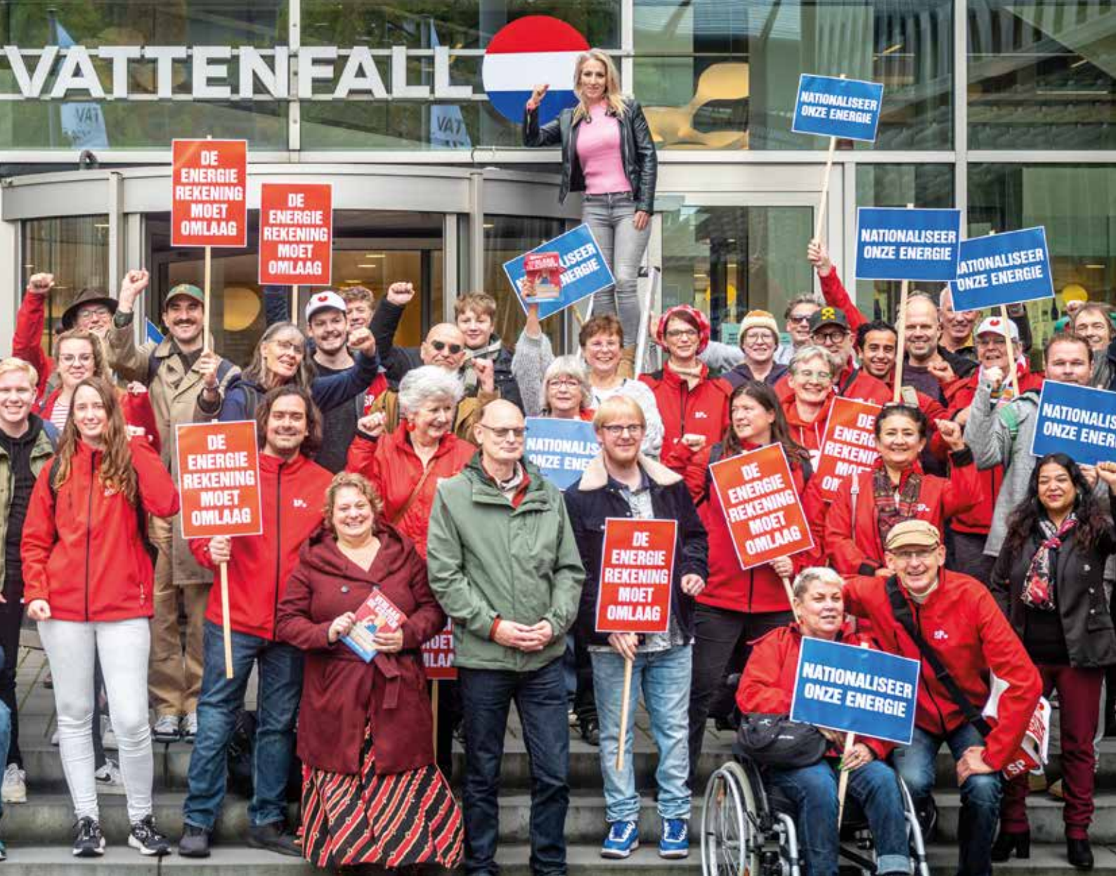
SP'ers nationaliseren op symbolische wijze het hoofdkantoor van energiereus Vattenfall in Amsterdam. Het Zweedse staatsbedrijf boekte de afgelopen twee jaar meer dan 800 miljoen euro winst in Nederland.