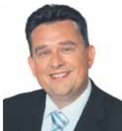
Emile Roemer Fractievoorzitter SP

Vriendelijke groet en bedankt voor uw medewerking.