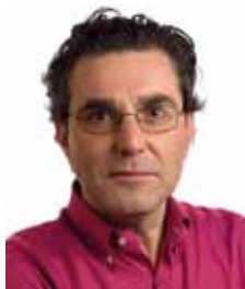
Henk van Gerven SP Tweede Kamerlid woordvoerder agrarische sector