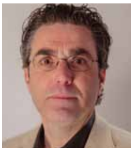
Henk van Gerven SP-Tweede Kamertlid

Is de overheid het probleem of is die toch nodig om oplossingen te bieden? In De Boer aan het Woord laten we de boeren spreken. In een later te verschijnen tweede deel, Hart voor de Boer , zullen we nader ingaan op de voorwaarden waaronder de boer naar onze mening een duurzame toekomst heeft en waarmee ongewenste schaalvergroting een halt kan worden toegeroepen.