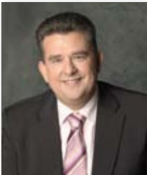
Emile Roemer SP-Tweede Kamerlid Wordvoerder verkeer

Ik wil alle schippers van harte danken voor hun medewerking aan dit onderzoek. Zij staan centraal. Om te komen tot de beste keuzes voor het veilig stellen van de toekomst van vele schippers, moet de schippers zelf de belangrijkste stem hebben. Dat onderzoek is daaraan een bijdrage. Maar hopelijk blijft het daar niet en wordt er ook in de toekomst geluisterd naar de schippers bij het werken aan oplossingen.